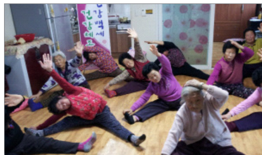
출처: 오병록(2106) 재인용 〈김제시의 그룹홈〉