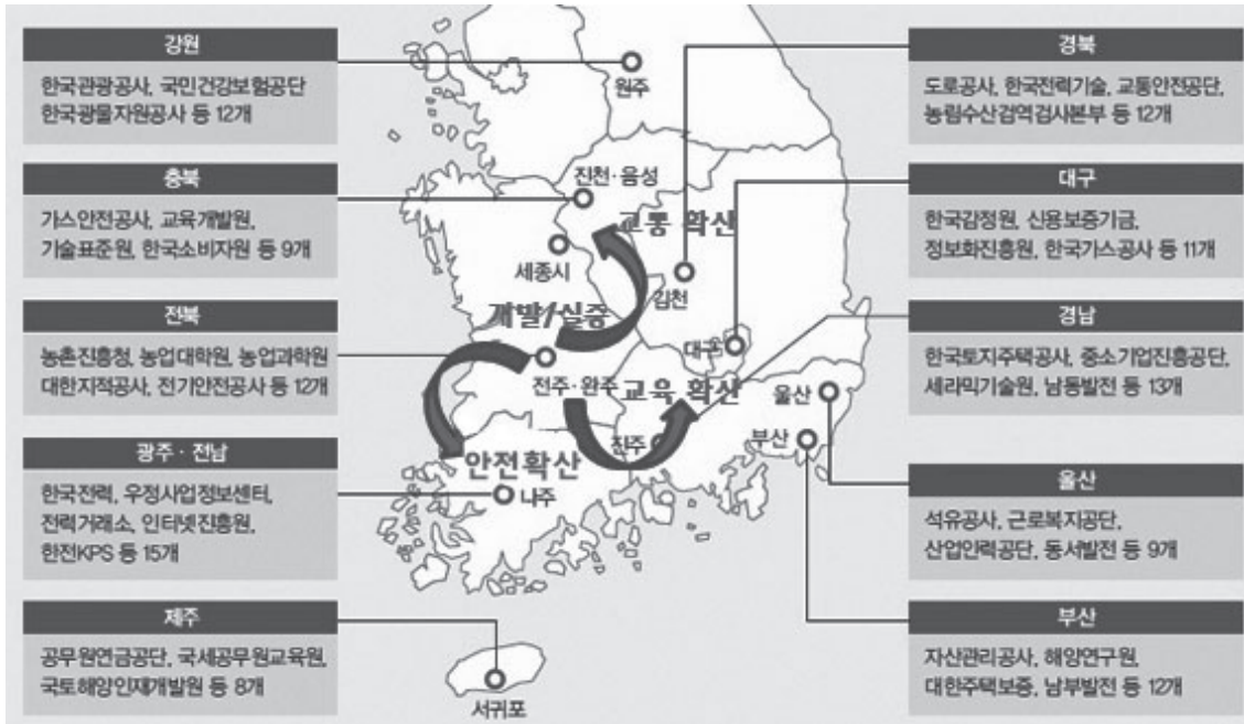
〈그림 7〉 혁신도시 정주여건 개선 리빙랩 핵심거점(안)

- 연구개발 실증이 원활하게 추진되기 위해서는 혁신도시를 규제 샌드박스로도 지정