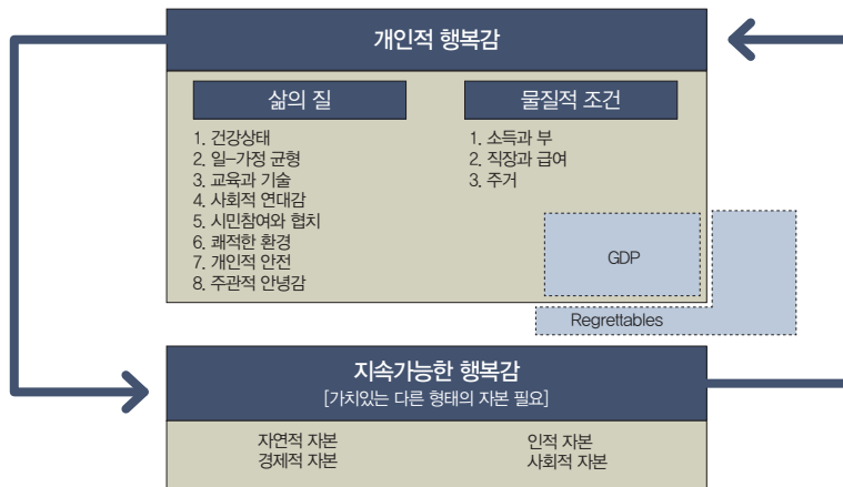
〈그림 1〉 행복(well-being)의 개념