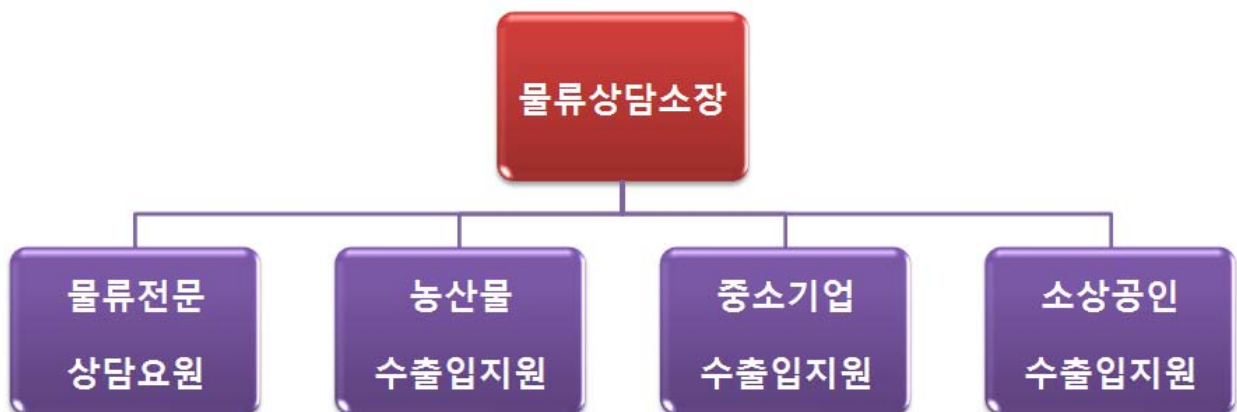
<그림 2> 수출입 물류상담소 운영방안